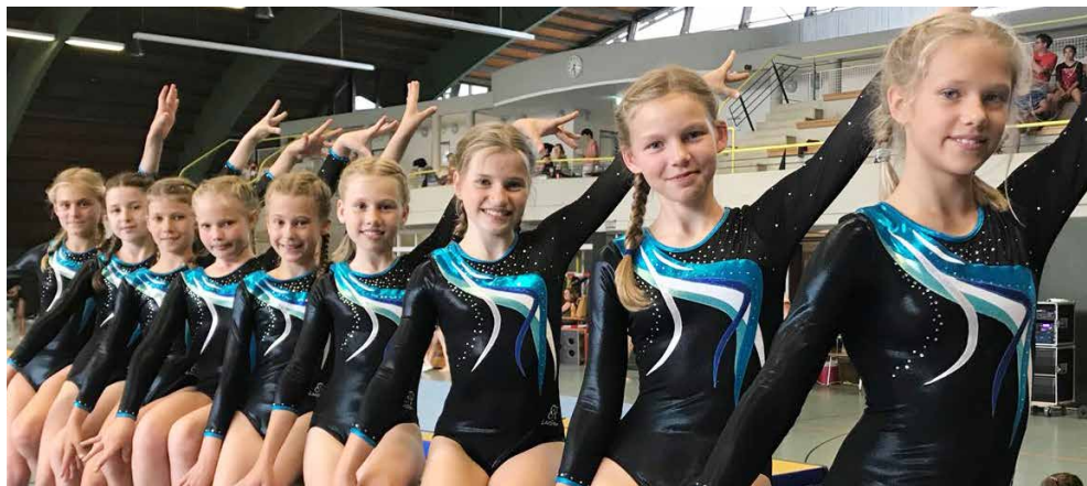
3. und 4. Mannschaft