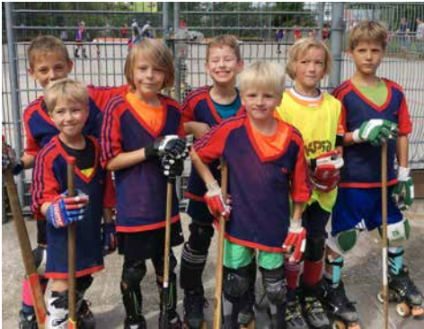
TSG Darmstadt Rookies