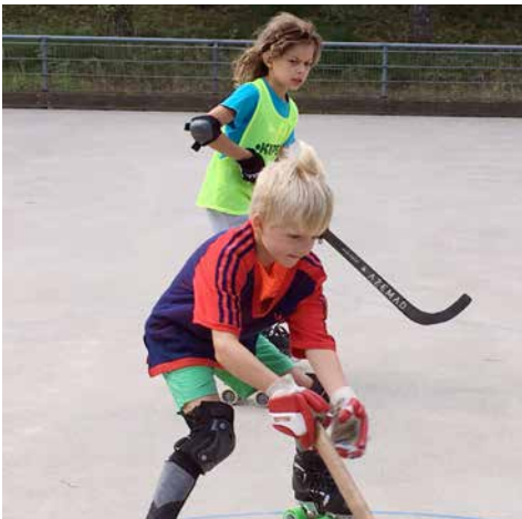
Rooky in Action