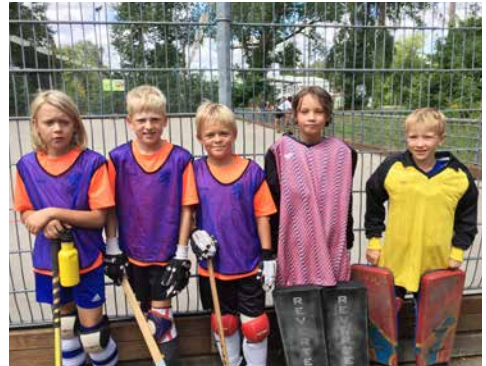
U11 der TSG Darmstadt