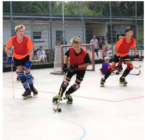
Die erfahrenen Trainingspartner im Spiel