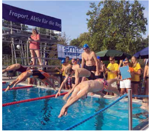
Start zur Staffel