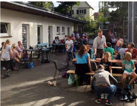
Nettes Beisammensein, leckeres Essen