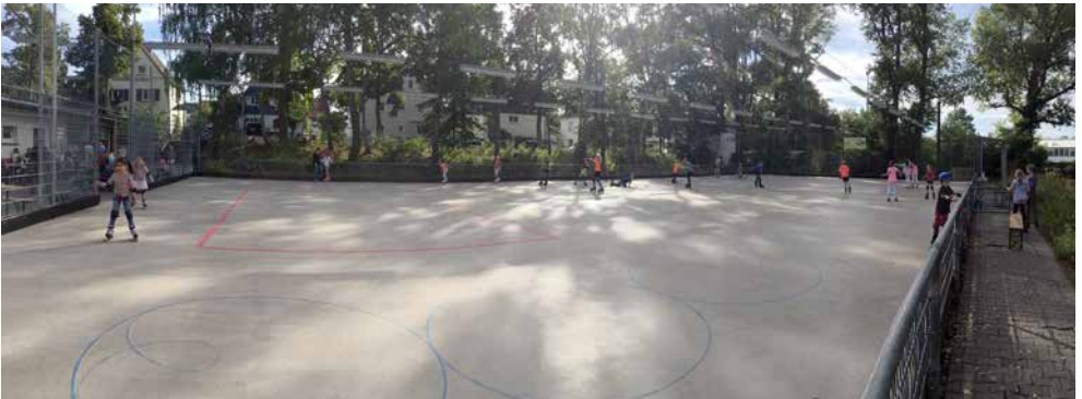
Das Panorama des schönen Außengeländes