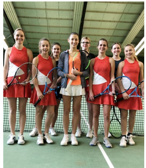
Beim Training kurz vor dem Lockdown