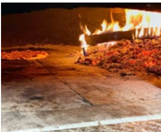
Pizza am Feuer im Holzofen