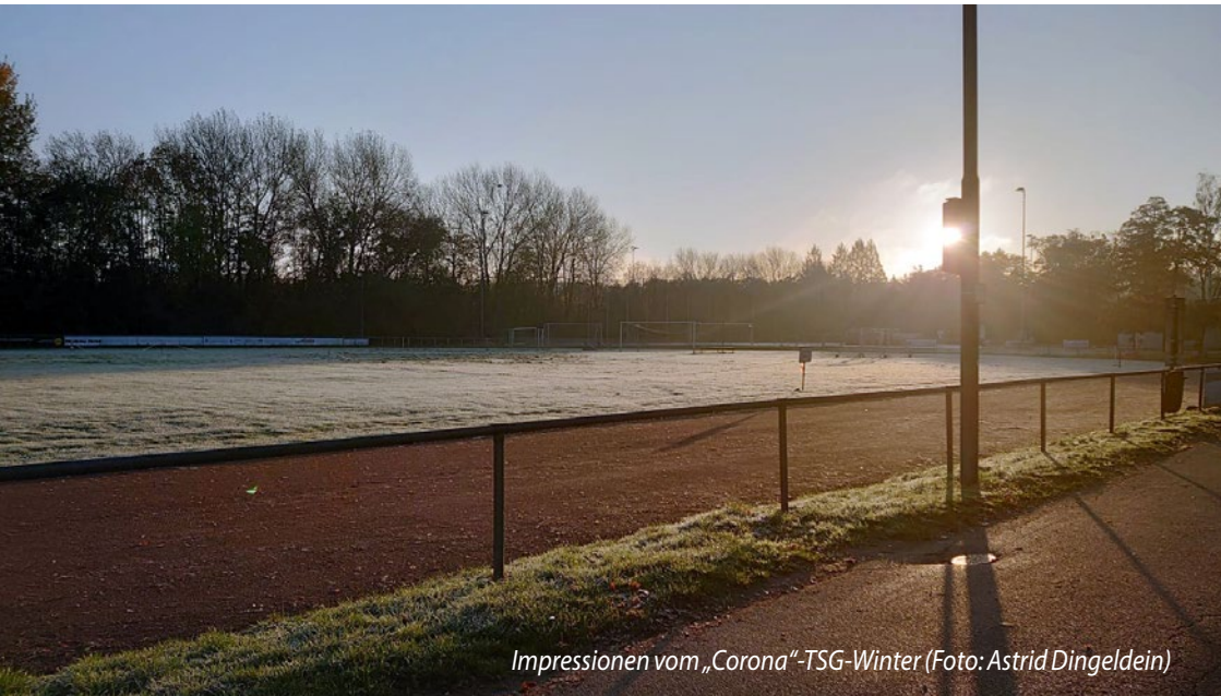
Impressionen vom „Corona“-TSG-Winter

Informationen für Mitglieder, Freunde und Förderer der Darmstädter Turn- und Sportgemeinde 1846 e.V.