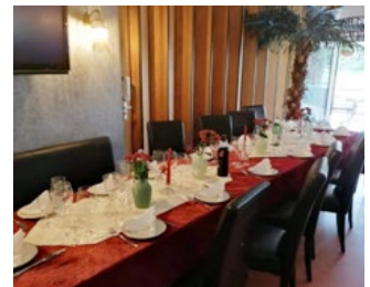
Gedeckter Tisch in der Gaststätte für die Zeit nach Corona