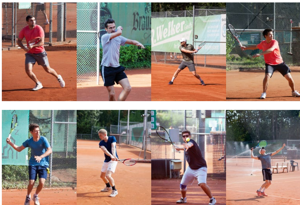
Spieler der ersten und zweiten Herrenmannschaft beim gemeinsamen Training