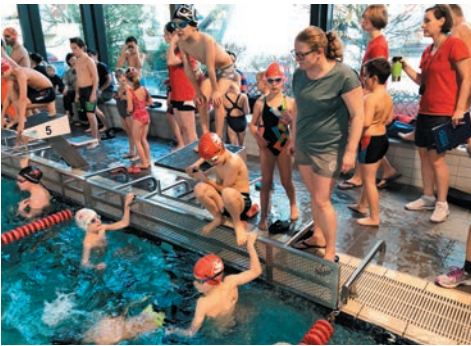
Betreutes Einschwimmen unseres Nachwuchses

Während die zweite Mannschaft in Griesheim startete, schwamm die erste Mannschaft in Hofheim. Vor allem für die Jahrgänge 2004 und jünger ging es darum, sich nochmal für die danach kommenden hessischen Meisterschaften vorzubereiten und