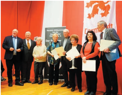
Neue Ehrenmitglieder - 50 Jahre Mitgliedschaft