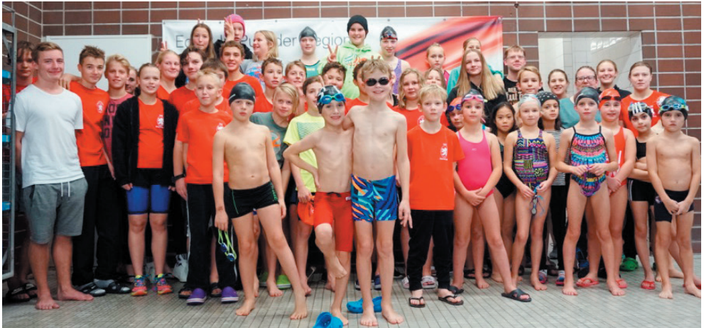
Teilnehmer an den Vereinsmeisterschaften