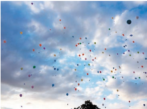
Eröffnung mit Luftballons

Gunter Eberling